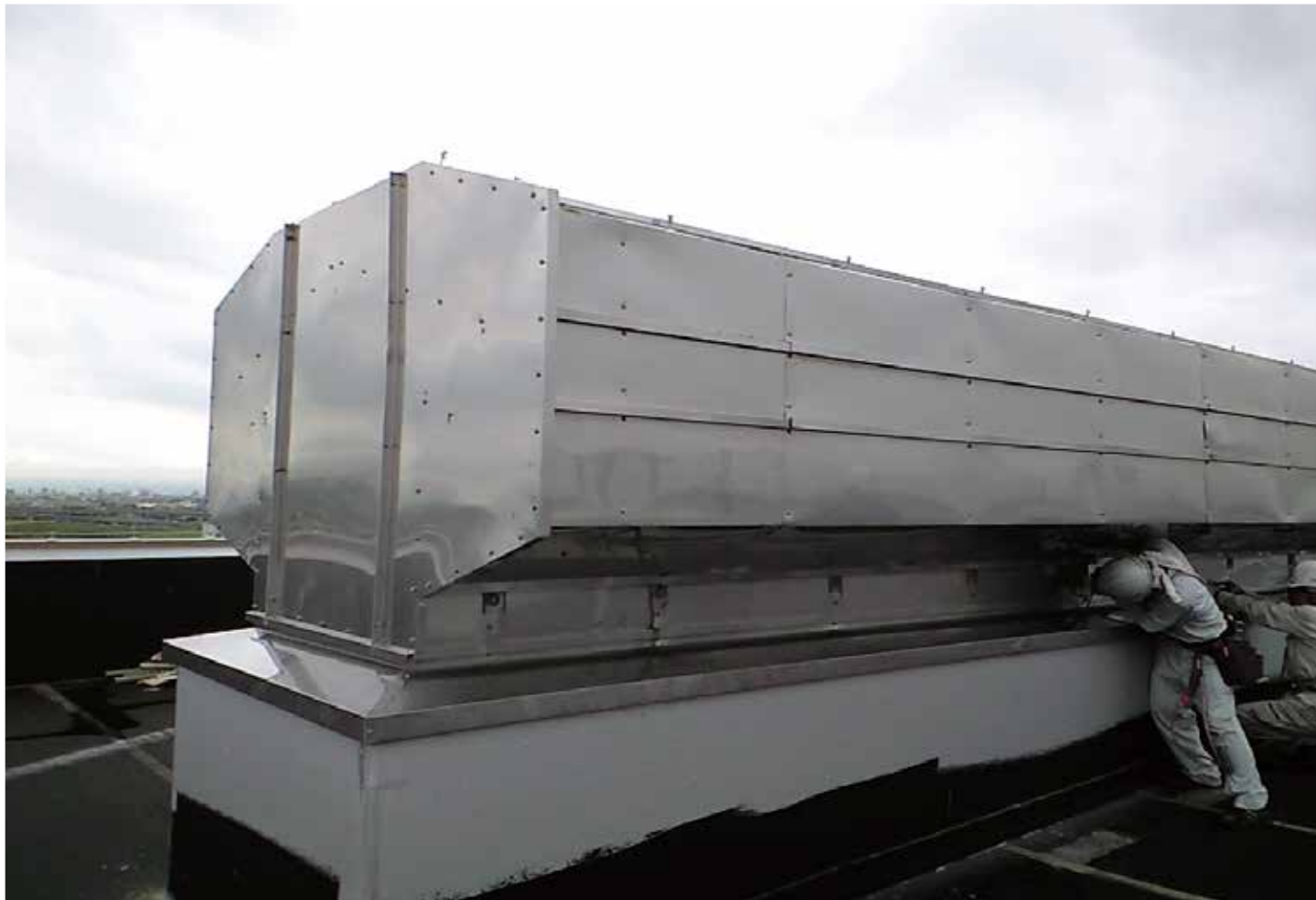
自然換気ベンチレーター（トップライト内蔵型）及び 折版トップライト