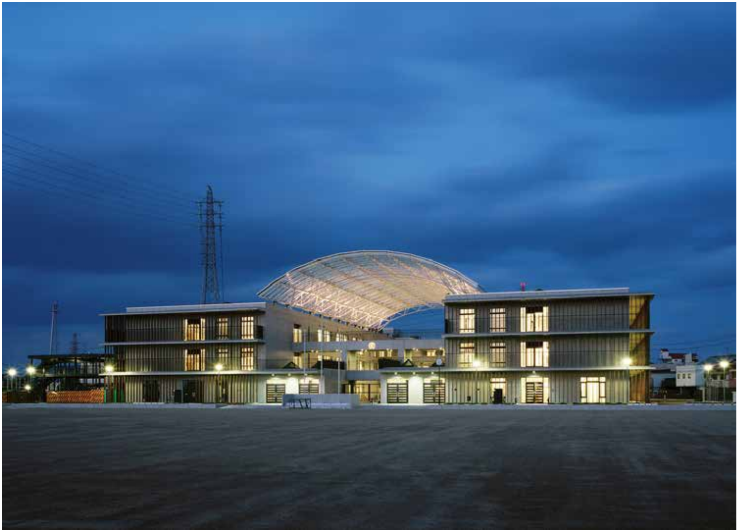
トップライト排煙兼用