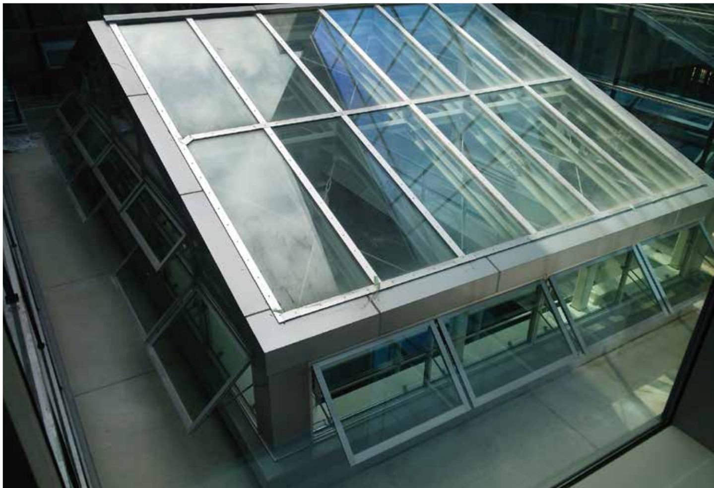
トップライト（排煙兼用）